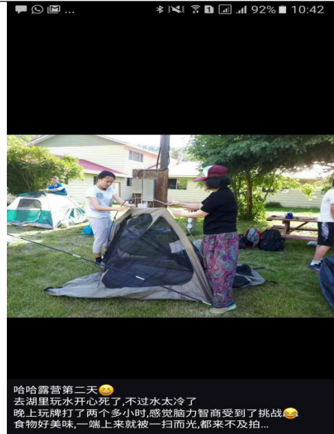
哈哈露营第二天 去湖里玩水开心死了,不过水太冷了 晚上玩牌打了两个多小时,感觉脑力智商受到了挑战 食物好美味,一端上来就被一扫而光,都来不及拍...