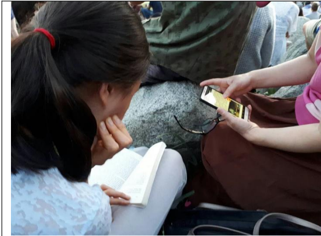
在等放烟花时读书