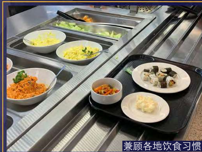
兼顾各地饮食习惯